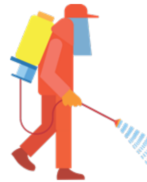
Traje para aplicação de herbicida