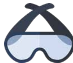
Óculos de proteção